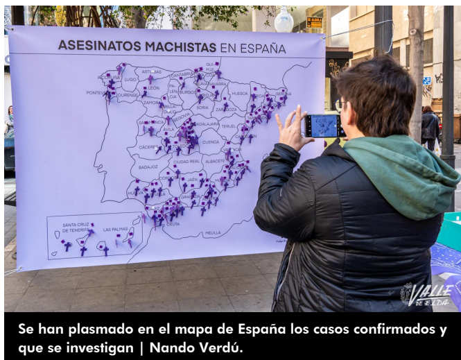
Se han plasmado en el mapa de España los casos confirmados y que se investigan | Nando Verdú.

En su manifiesto han comenzado recordando que “93 mujeres han sido asesinadas por hombres, aunque según las cifras oficiales son 54. Un total de 1.239 desde que se empezaron a registrar estos datos en 2003”. La asamblea ha destacado que “La cara más visible y la última consecuencia de la violencia machista son los asesinatos, sin embargo, los intentos de asesinato han aumentado un 50% desde 2021. Eso significa que podríamos estar hablando de cifras todavía más dramáticas, de haberse consumado”.