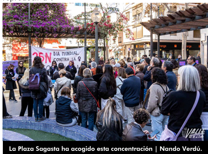
La Plaza Sagasta ha acogido esta concentración

prostitución, y no permitir ninguna actividad que mercantilice el cuerpo de las mujeres y su capacidad reproductiva”.