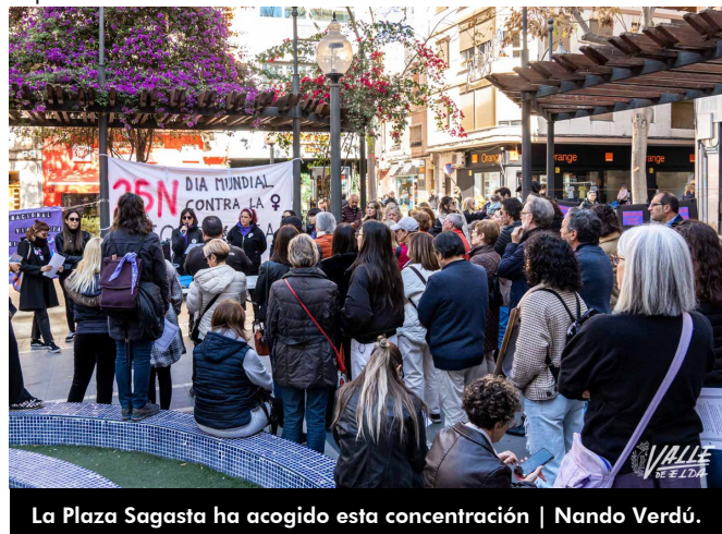
La Plaza Sagasta ha acogido esta concentración | Nando Verdú.

prostitución, y no permitir ninguna actividad que mercantilice el cuerpo de las mujeres y su capacidad reproductiva”.