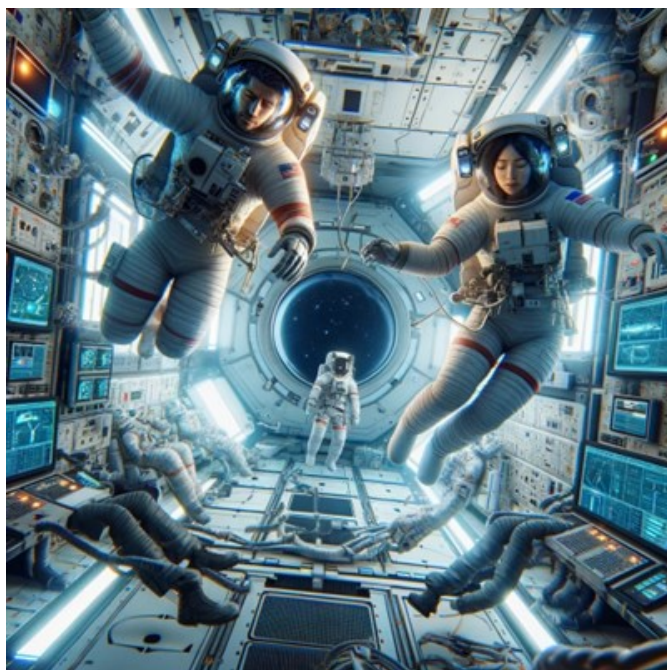
Astronautas experimentando la ingravidez en la Estación Espacial Internacional | Imagen creada con CHAT GPT DALL-E.

La gravedad en el marco clásico es una fuerza atractiva que actúa sobre los objetos, sean cuales sean, incidiendo sobre todo su volumen, ya sean gases, líquidos o sólidos. Sin gravedad no habría atmósfera. Sin gravedad no es concebible la vida como la conocemos. La gravedad protagoniza todos los procesos cotidianos. La ingravidez consistiría en eliminar la fuerza que caracteriza a la gravedad, lo cual es sinónimo de eliminar la causa que la produce. Debido a la gravedad la presión en un fluido se incrementa con la profundidad o el espesor. La presión es la fuerza que se ejerce por unidad de superficie, con lo que, si situamos un objeto en un fluido, debajo de él, la presión será mayor que por encima de él. Esto es lo que Arquímedes adelantó y lo que justifica que un objeto sumergido en un fluido experimente un empuje hacia arriba. La densidad caracteriza la compacidad de un cuerpo y el peso de un volumen determinado. Si sumergimos en agua un objeto con menor densidad que la del agua, pesará menos el volumen del objeto que el del agua que desaloja y actuará sobre él una fuerza que lo hará flotar y subir a la superficie. Si suprimimos la gravedad, no hay flotación que valga. Pero, es más, tampoco se sumergirán los cuerpos y no se hundirán en los líquidos.