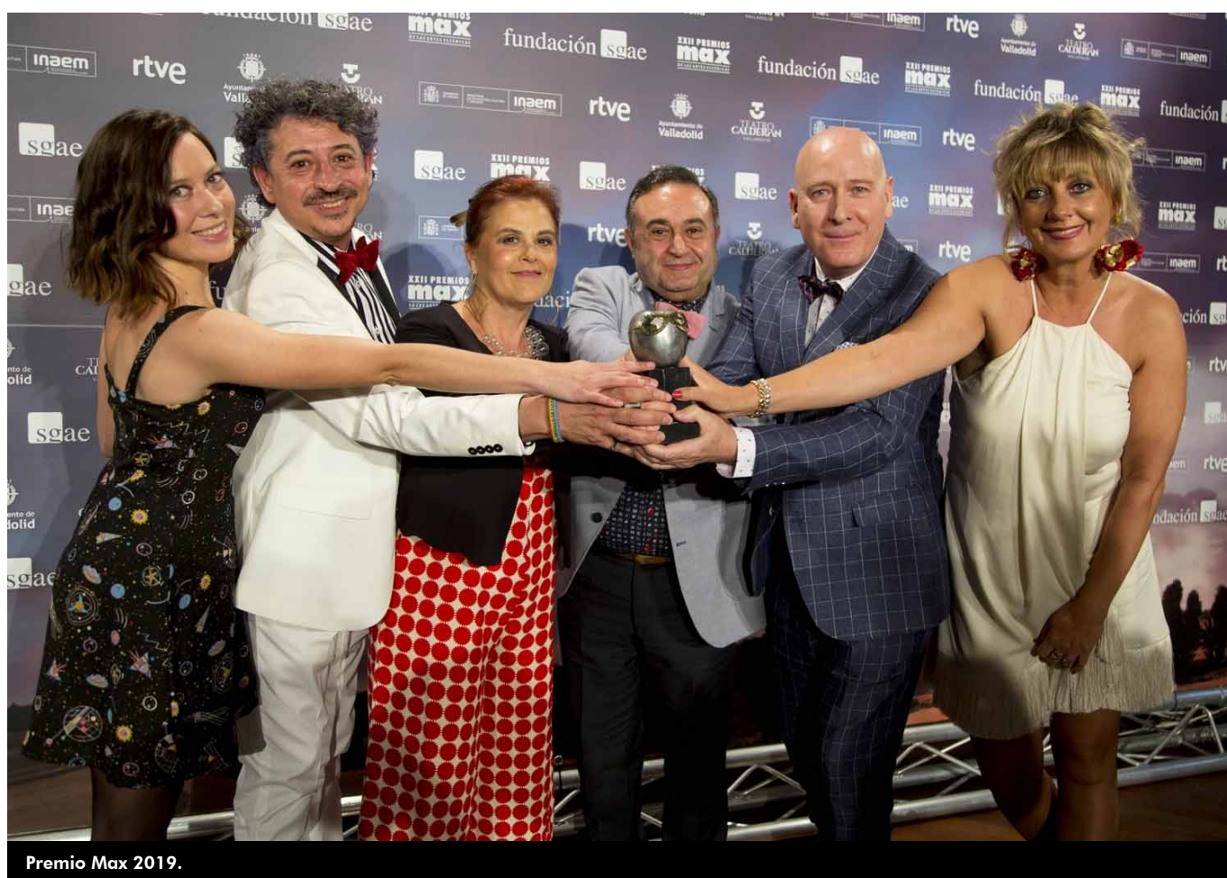
Premio Max 2019.

Taules Teatre lleva cuarenta años dinamizando el panorama teatral desde Pinoso, núcleo de su fundación. Con la veteranía que le dan más de un centenar de premios (los últimos merecidamente ganados en el certamen Escena Elda por un impecable montaje de Mi Mejor Amigo, Yo ), más de sesenta montajes y giras nacionales e internacionales (México, India), este grupo es todo un referente de profesionalidad a raudales y amor por el trabajo bien hecho.