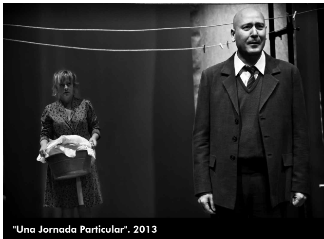
"Una Jornada Particular". 2013