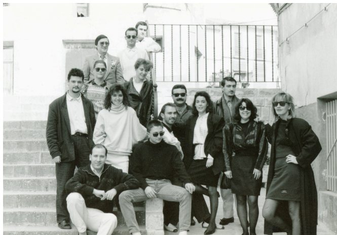
Componentes de Taules Teatre en 1989.

Tres premios en la última edición del Certamen Escena Elda, entre ellos Primer Premio a la mejor obra, Premio a la mejor dirección y Premio a la mejor puesta en escena. Después de tantos años y con el palmarés recopilado por Taules Teatre, ¿siguen importando los galardones?