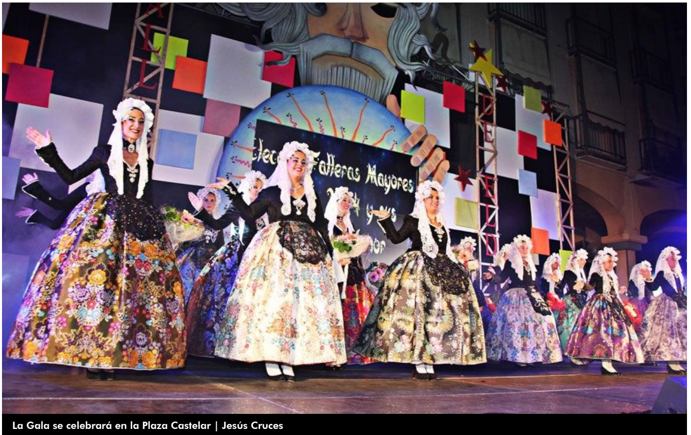
La Gala se celebrará en la Plaza Castelar | Jesús Cruces

La Junta Central de Fallas realizará esta noche la tercera y última parte del proceso para la elección de las Falleras Mayores de Elda y sus Damas de Honor de 2015. Mañana, la Plaza Castelar será testigo del nombramiento de los nuevos cargos en una gala cargada de sorpresas que emocionará a los asistentes.