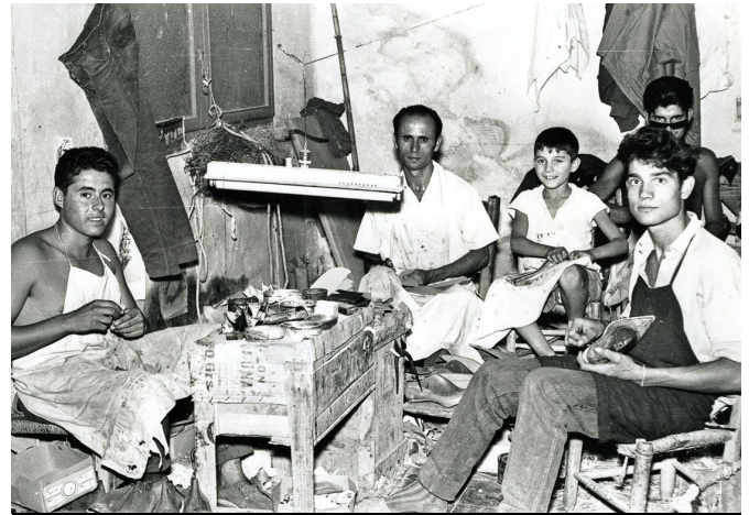
La aportación de los trabajadores fue esencial en el crecimiento en el sector

La ciudad de Elda ha sido y sigue siendo muy dependiente de la evolución del sector calzado. Esta industria ha sido siempre muy dinámica y ha jugado un papel fundamental en el desarrollo económico y en su crecimiento. Durante los años 60 y 70 del siglo XX, España gozaba de algunas ventajas económicas importantes respecto al resto de países de nuestro entorno. Estaba muy cerca el Plan de Estabilización Económica de 1959, este decreto ley hizo que nuestro país iniciara un proceso de apertura al exterior y que abandonáramos el aislamiento internacional. Por ello, en Elda se empezó a fraguar la necesidad de exportar nuestros zapatos. Esta válvula exportadora y nuestra ventaja en salarios, creatividad y diseño contribuyó a que de manera continuada se fueran asentando cada vez más compañías comercializadoras de los EEUU y alguna de Europa. Esta fue la primera y gran transformación económica y social que duró hasta los años 80 del siglo pasado.