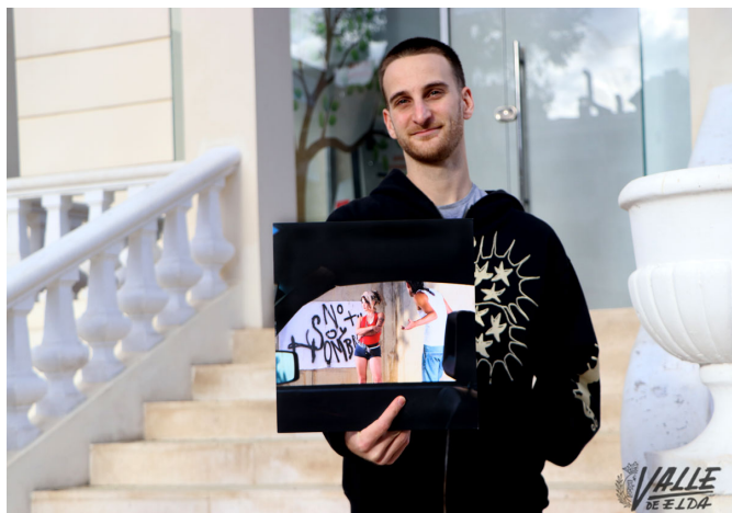
El eldense ha destacado que seguirán trabajando juntos | Marta Maestre.

en ventas en vinilo, ahora puedo demostrar mi potencial. He hecho una producción importante de un disco de una discográfica importante".