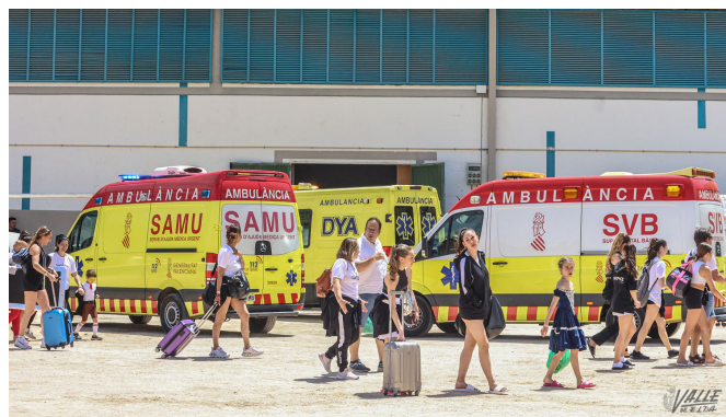
Las ambulancias han acudido rápidamente