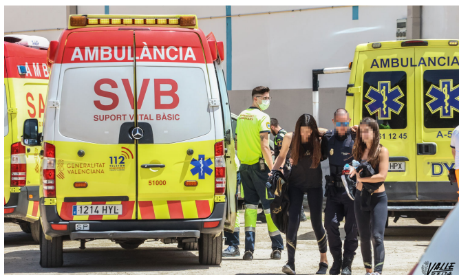
La Policía Nacional ayudando a sacar a dos menores

Los Bomberos han acudido rápidamente así como la Policía Local y Nacional y las ambulancias. Han ayudado a los heridos y han desalojado las instalaciones, que permanecerán cerradas hasta nuevo aviso.