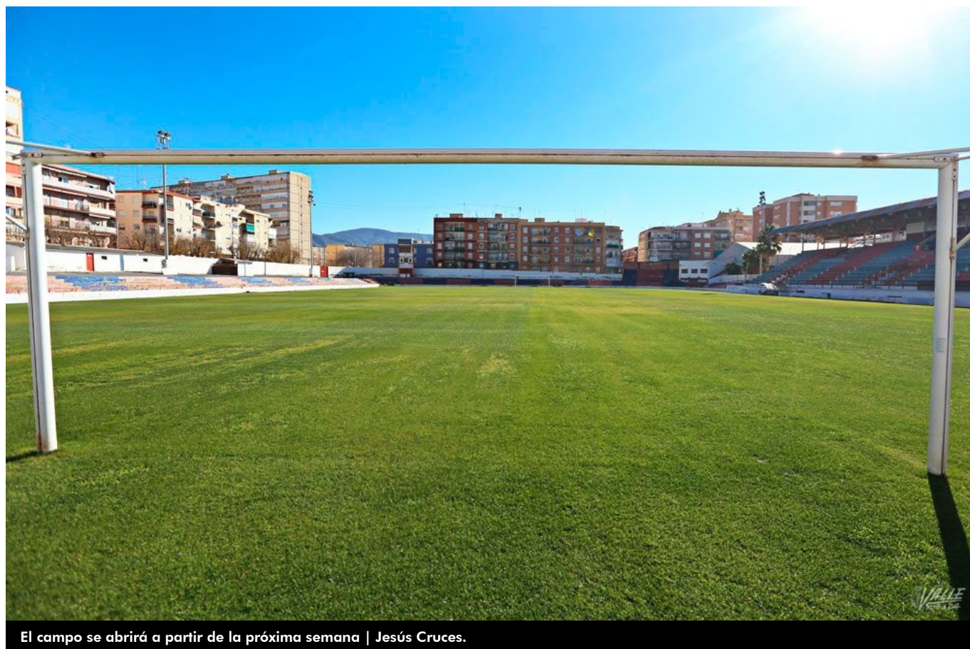
El campo se abrirá a partir de la próxima semana | Jesús Cruces.

El antiguo Pepico Amat desde hace años no tenía el campo tan cuidado como en la actualidad, el césped natural es de una calidad envidiable tras su replantación después del Campeonato de Supercross. Los clubes eldenses podrán disfrutar de este terreno tras años en los que su mal estado impedía su correcto uso, pues fueron muchos los equipos que se quejaban de su mal estado.