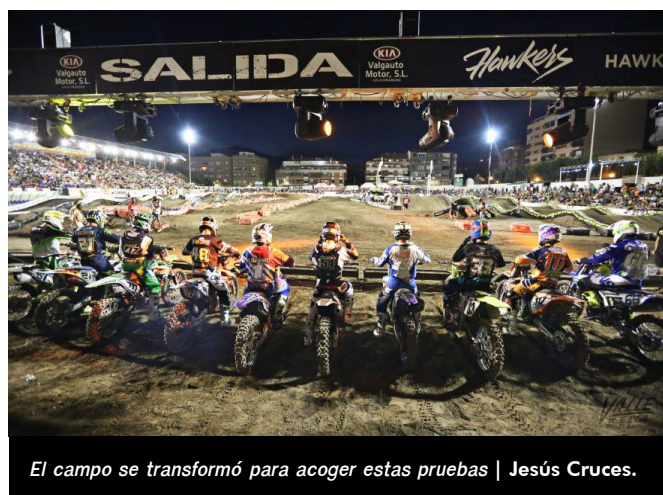
El campo se transformó para acoger estas pruebas | Jesús Cruces.

los plazos de espera, pues se contaba con que este terreno estuviese a punto hace aproximadamente un mes.