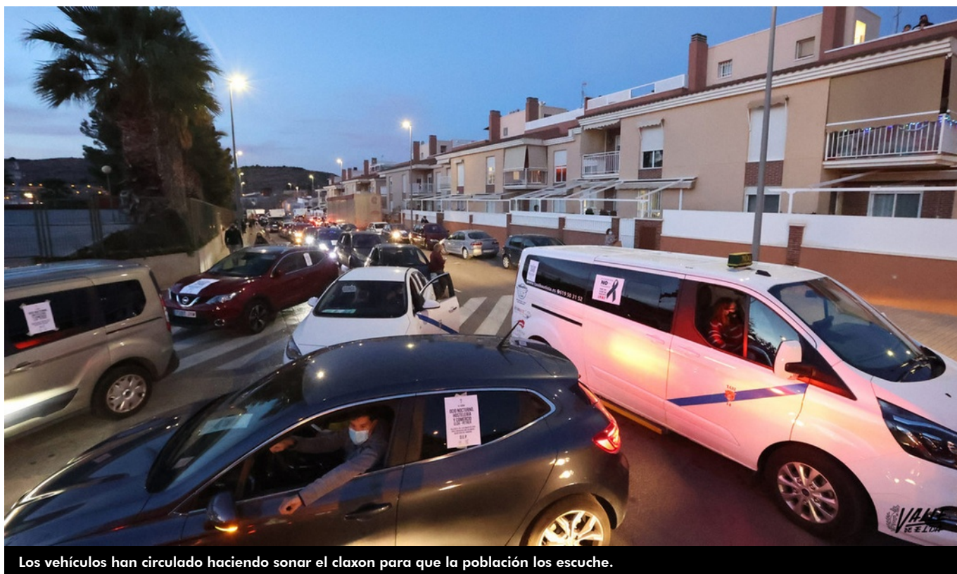
Los vehículos han circulado haciendo sonar el claxon para que la población los escuche.

Numerosos vehículos han recorrido hoy las principales arterias de Elda y Petrer durante la manifestación convocada por la Asociación de Locales de Ocio de Elda y la Asociación de la Hostelería de Petrer en defensa del ocio nocturno, la hostelería y el comercio bajo el título "Ahora más que nunca SOS" .