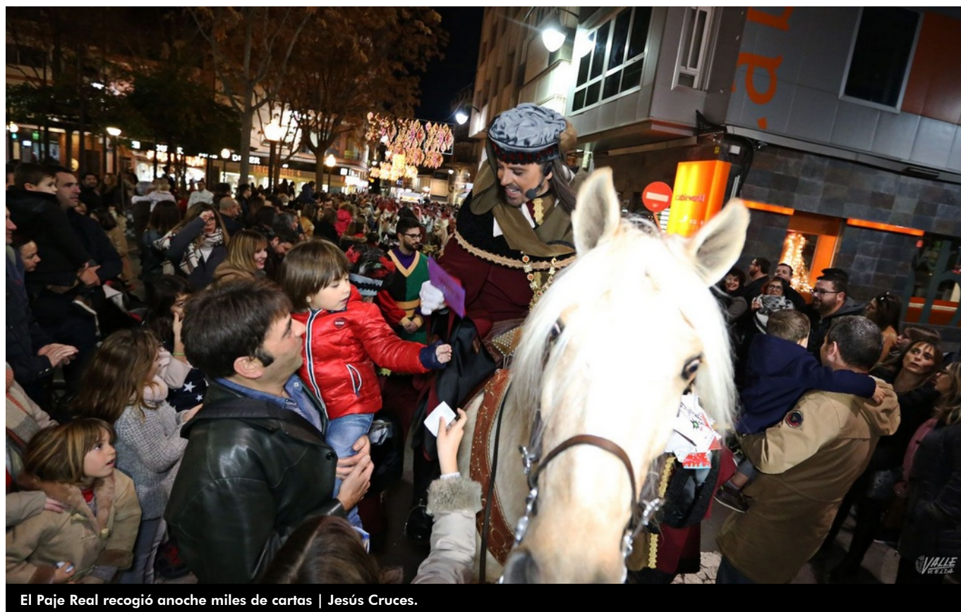
El Paje Real recogió anoche miles de cartas | Jesús Cruces.

La magia de la Navidad trajo ayer consigo la visita del Paje Real a la ciudad para recoger las cartas de los niños eldenses . La alegría y la ilusión eran visibles en las caras de los pequeños, que levantaban con fuerza sus brazos para entregar las cartas y recoger caramelos . Este acto, muy arraigado en la ciudad, desembocó en una gran fiesta de la Navidad en la Plaza Castelar de la mano de la cantante eldense Alba Ed-Dounia .