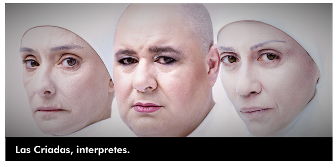
Las Criadas, intérpretes.

absoluto la calidad de la propuesta y el trabajo actoral de sus intérpretes. Una buena ocasión de seguir redescubriendo el universo de Lorca, tan complejo, atractivo y apasionante.