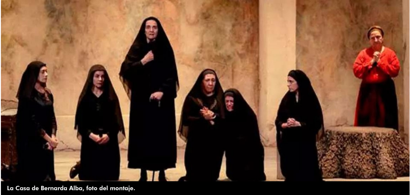
La Casa de Bernarda Alba, foto del montaje.

La actual temporada de teatro sigue avanzando y noviembre presenta al espectador una serie de propuestas interesantes y de calidad. Grados autores, intérpretes, directores y montajes nos indican que el teatro sigue vivo y con ganas de ofrecer al público espectáculos variados y estimulantes.