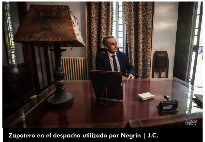
Zapatero en el despacho utilizado por Negrín