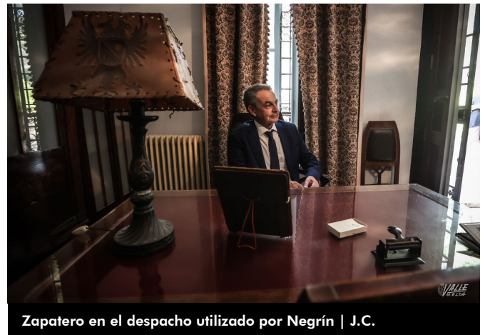
Zapatero en el despacho utilizado por Negrín