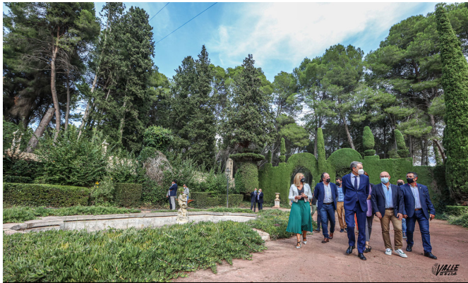
Zapatero ha estado acompañado por representantes de la Generalitat y de la comarca

acudido a El Fondó, en Monóvar, pues desde su aeródromo se marcharon hacia el exilio las personalidades políticas y militares más importantes del gobierno de la Segunda República.