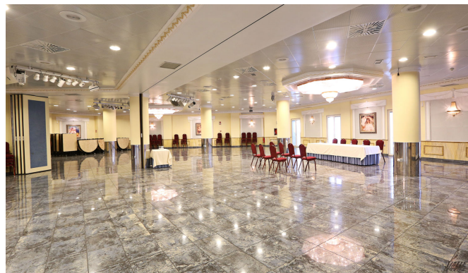
La feria se celebraría en los Salones Princesa | Jesús Cruces.

darse a conocer y no coincidirá con las ferias para que las grandes marcas puedan estar presentes también" .