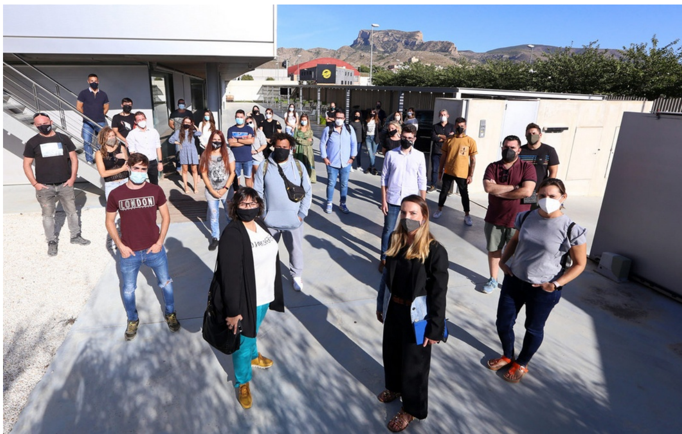
Imagen de los participantes de la nueva edición de Petreremprende.

Petreremprende, la lanzadera de ideas y proyectos empresariales impulsada por el Ayuntamiento de Petrer de la mano de la cooperativa Genion, ha cumplido su primer lustro aumentando la cuantía de los premios para apoyar la innovación hasta los 10.000 euros, 3.000 euros más que en la edición de 2019.