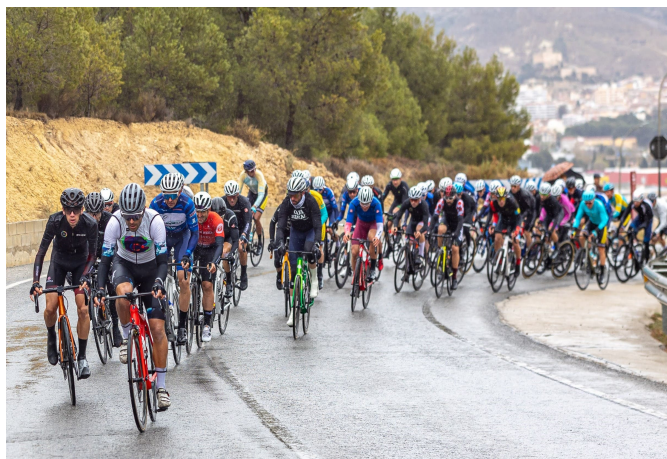
Momento de la ascensión al Alto de La Torreta en Elda