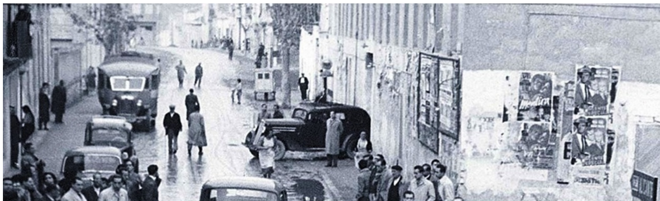
Esquina del garaje Monumental en la avenida de Chapí. El surtidor de gasolina se aprecia a la derecha de la foto, junto a la fachada del citado garaje.

La acelerada industrialización de la economía eldense a lo largo de la década de los años veinte y treinta del siglo XX y el desarrollo del tráfico rodado de vehículos a motor, tanto a nivel local como de camiones y automóviles que circulaban por la carretera nacional a su paso por Elda en dirección a Alicante, Albacete, Madrid o pueblos más cercanos, hizo que la compañía CAMPSA que tenía el monopolio estatal de la distribución de combustibles instalara surtidores de gasolina en varios puntos del trazado de la carretera N-330 a su paso por nuestra ciudad.