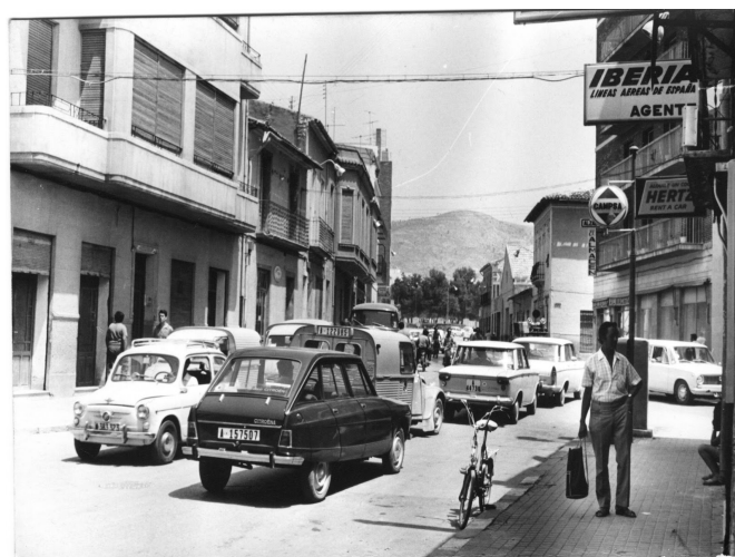
Vista de la calle General Aranda (act. Pedrito Rico) con la señalética todavía del surtidor de CAMPSA, ya clausurado.

Si en febrero de 1934 la CAMPSA ya solicitó autorización al Ayuntamiento de Elda para instalar un surtidor de gasolina en el p.k. 375,4 de la citada carretera, o lo que es lo mismo, en la actual Avenida de Chapí, junto al entonces Garaje Monumental; la necesidad del servicio ante la cada vez mayor demanda hizo que el 12 de julio de 1934 la citada compañía estatal de petróleos solicitara de nueva autorización para instalar otro surtidor en la confluencia de la calle Pablo Guarinos (act. Pedrito Rico) con calle Jardines , es decir, en el punto kilométrico 374,60 de la carretera N-330, de Alicante a Francia por Zaragoza .