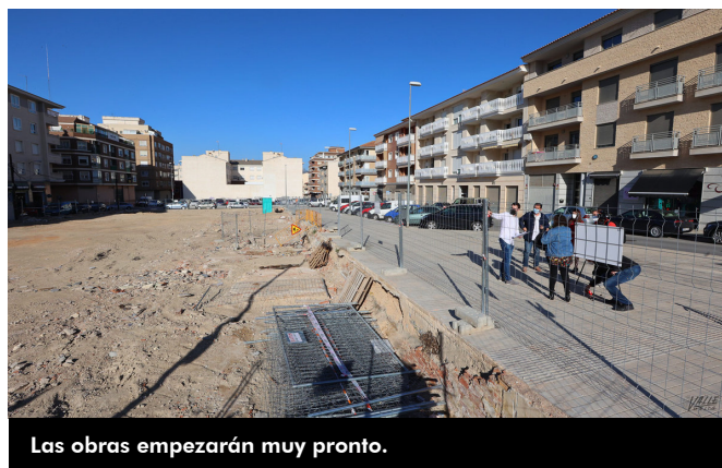
Las obras empezarán muy pronto.

Las obras se realizarán de forma paralela a la construcción del supermercado, por lo que se espera que todo esté a punto para finales de año.