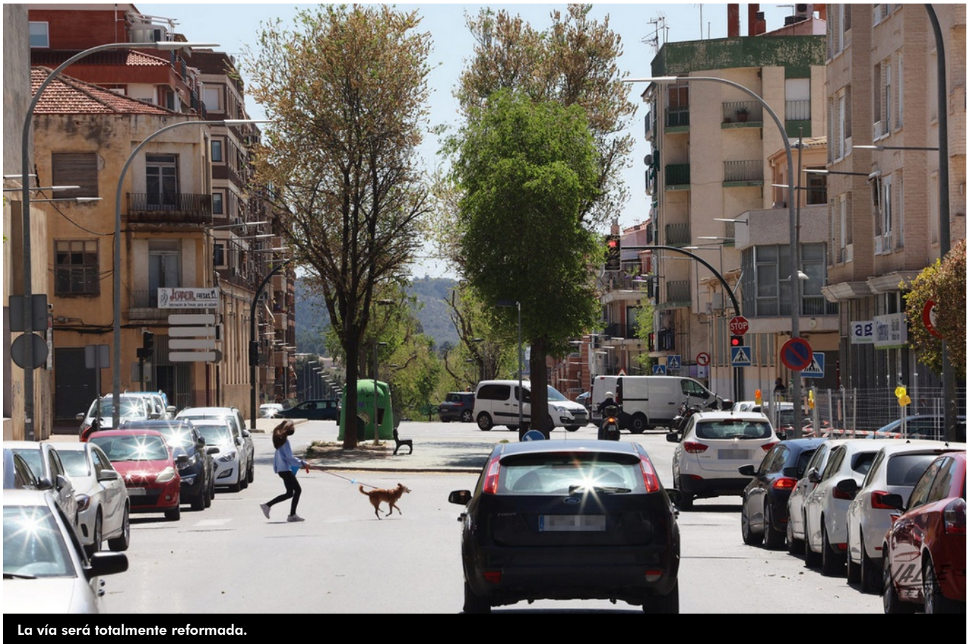
La vía será totalmente reformada.