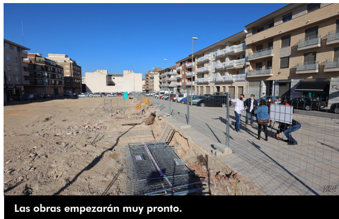
Las obras empezarán muy pronto.

Las obras se realizarán de forma paralela a la construcción del supermercado, por lo que se espera que todo esté a punto para finales de año.