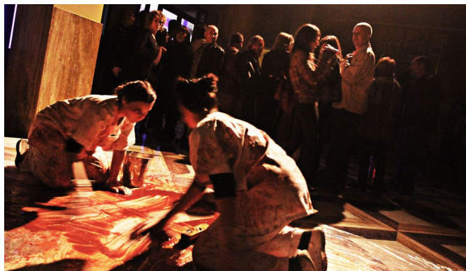
Los actores del Taller de Teatro realizaron una aterradora puesta en escena | Jesús Cruces.

Los más jóvenes también pudieron disfrutar de un foso del terror en el Centro Cívico y Juvenil, en el que un grupo de jóvenes de entre 15 y 17 años colaboraron con la Concejalía de Juventud en la realización de un pasaje del terror. Fueron cientos de personas las que hicieron cola en la plaza de la Ficia a la espera de realizar el