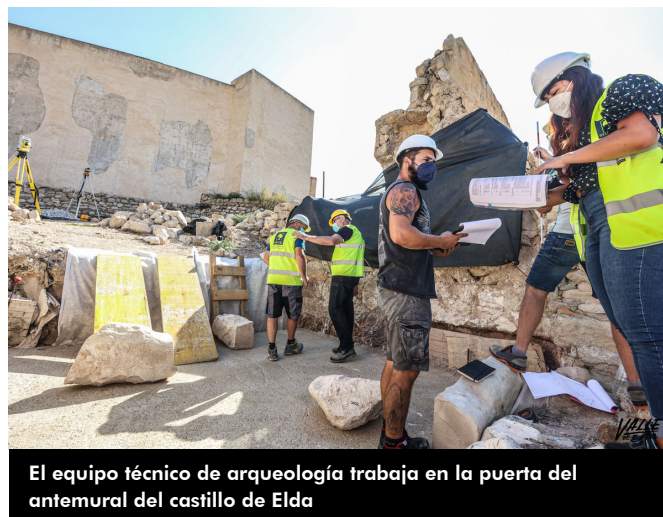
El equipo técnico de arqueología trabaja en la puerta del antemural del castillo de Elda