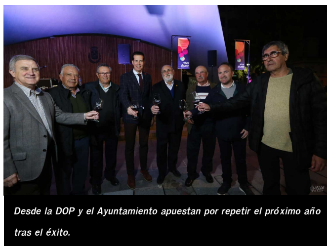
Desde la DOP y el Ayuntamiento apuestan por repetir el próximo año tras el éxito.