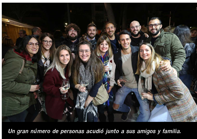
Un gran número de personas acudió junto a sus amigos y familia.

En esta cata de vinos los eldenses pudieron degustar los múltiples vinos de 23 bodegas de la provincia . Así probaron diferentes variantes de blancos -afrutados, dulces y secos-, también moscateles, rosados, tintos -reserva, de crianza o añada- y el vino por excelencia del Mediterráneo, el fondillón . También se ofrecieron con quesos y salazones.