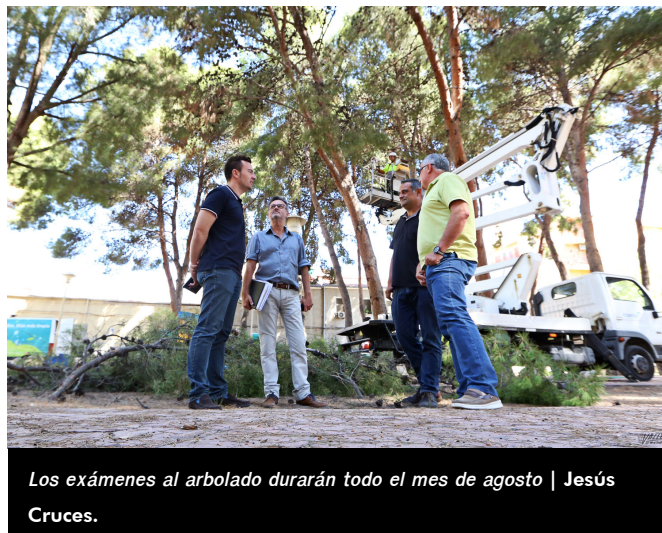
Los exámenes al arbolado durarán todo el mes de agosto | Jesús Cruces.

importantes, debido a la mayor afluencia de gente en ellos, pero se hará en todos los parques de la ciudad. El edil de Mantenimiento ha querido subrayar que “no sólo se va a revisar el arbolado de los parques y jardines, sino todos aquellos árboles de gran porte” de entre los 15.000 ejemplares que existen en la ciudad.