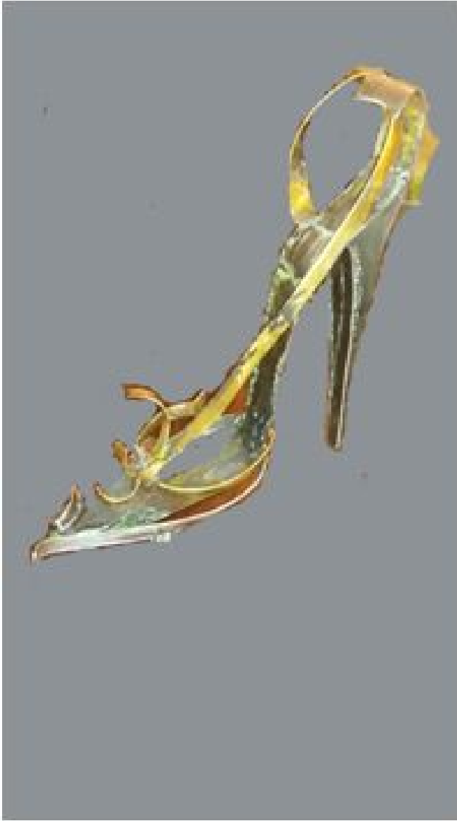
Boceto del zapato de tacón de aguja ofrecido por Francho hecho en chapa y acero.

Pero los zapatos no solo los encontramos en ciudades zapateras. Hace poco un amigo me remitió unas fotos de una de las esculturas más visitadas en la ciudad de Laguardia. Junto a la iglesia de Santa María de los