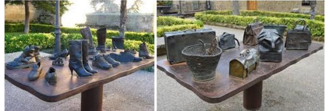
Esculturas en una plaza junto a la Iglesia de Santa María en Laguardia (Álava).

Reyes, nos encontramos con esta original escultura compuesta de dos mesas, una llena de zapatos y otra de bolsos, en homenaje a los que tanto viajamos, es decir, en esta ocasión, tanto los zapatos como los bolsos no se refieren a ninguna industria o tradición en particular, simplemente se trata de un homenaje al viajero, así es "al viajero", a la persona que frecuenta las distintas ciudades y pueblos caminando sus calles y plazas, para lo cual evidentemente hace falta zapatos y, en el caso de las señoras, bolsos.