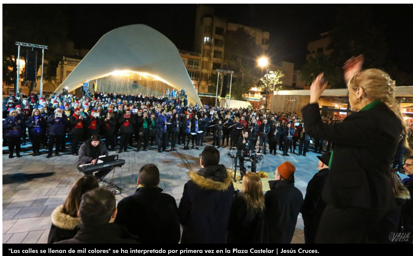
"Las calles se llenan de mil colores" se ha interpretado por primera vez en la Plaza Castelar | Jesús Cruces.

La música de Moros y Cristianos avivó los corazones de cientos de eldenses en la fría tarde de ayer gracias al desfile de collas . Acto que anuncia la llegada de la Media Fiesta y que devolvió los pasodobles y marchas moras a las calles de Elda. En el año en el que las fiestas más multitudinarias y seguidas de la ciudad cumplen 75 años, la Junta Central de Moros y Cristianos ha dado un giro a este acto y por primera vez las nueve collas de las comparsas interpretaron junto al coro de la Mayordomía de San Antón la pieza Las calles se llenan de mil colores en la Plaza Castelar y no frente al Ayuntamiento.