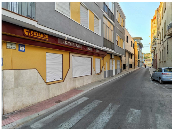
Esta calle une Gabriel Payá con La Huerta. Año 2022