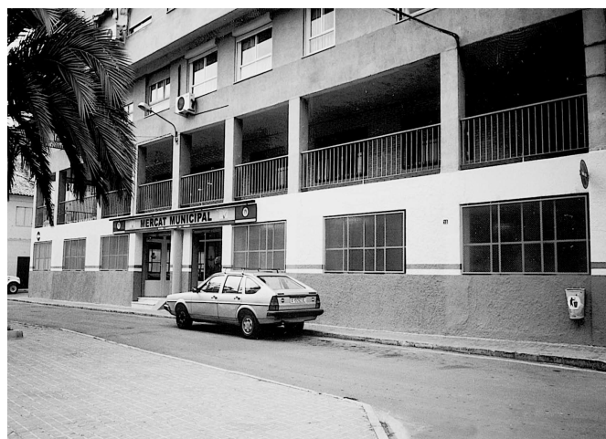
El mercado municipal estaba en la calle Luis Chorro. Año 1997.