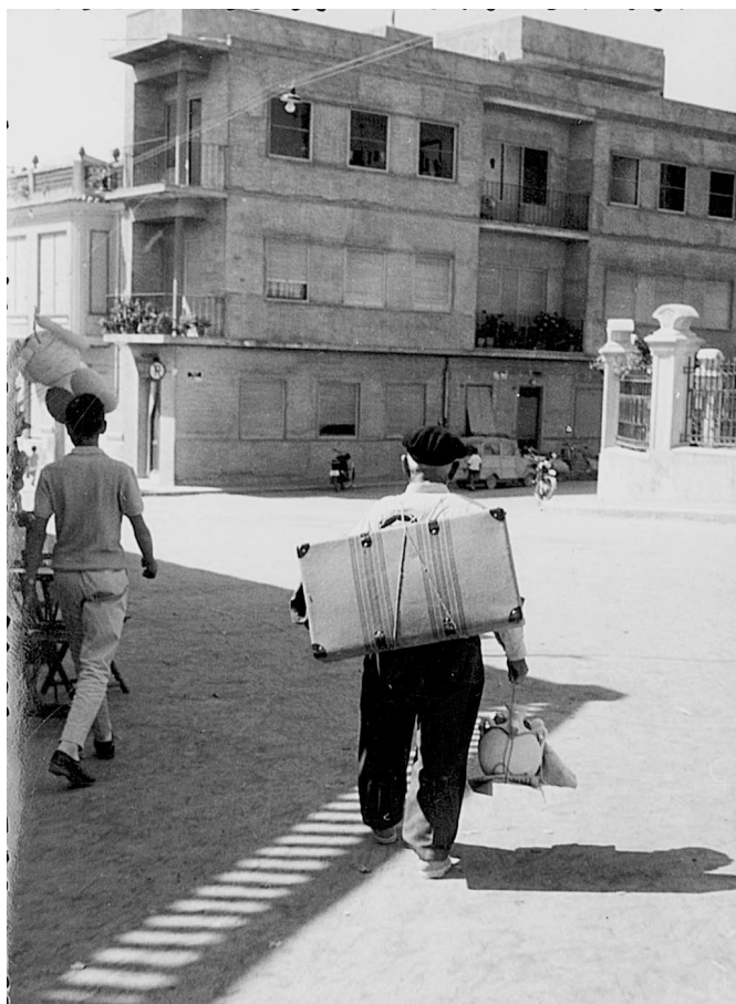
Confluencia de las calles Luis Chorro y Gabriel Payá. Año 1961