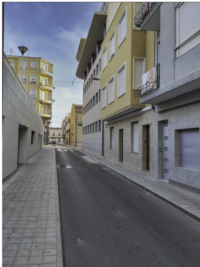
Son perpendiculares a la calle Luis Chorro, las calles Gabriel, Payá, Constitución y La Huerta. Año 2022 | Pascual Maestre.

obra constituye un nuevo homenaje a la figura del relevante escritor gracias a la iniciativa de la concejalía de Cultura.