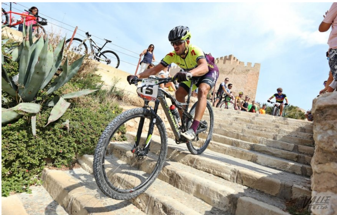
Los corredores han pasado por el Castillo de Petrer | Jesús Cruces.

Las localidades de Elda y Petrer se han convertido esta mañana en el circuito del Open XCM BTT de la Comunidad Valenciana en el que han participado un total de 189 corredores tanto valencianos como de distintas comunidades autónomas de España. Cientos de personas se han acercado al recorrido para animar a los deportistas y disfrutar de esta jornada en la que ambos municipios se han situado en el mapa ciclista de España.