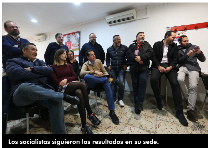
Los socialistas siguieron los resultados en su sede.