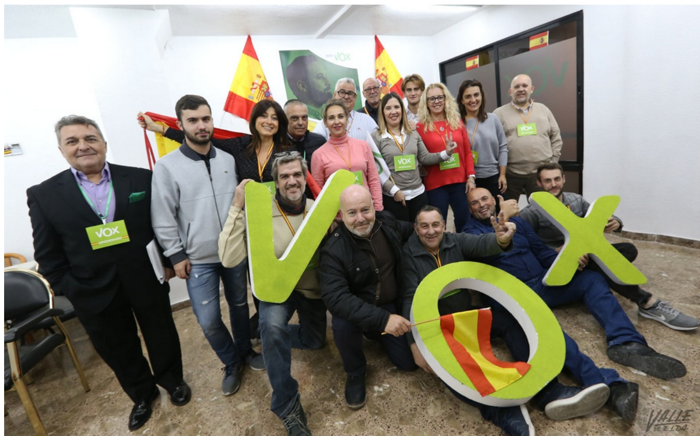
Vox celebran el aumento de votos tras las elecciones.

La mayoría de eldenses han votado al PSOE en las elecciones nacionales al Congreso con un 32,28% de los votos, manteniendo la tónica del resto del país . Los socialistas vuelven así a ganar en la ciudad y suben en porcentaje de apoyos, pues en abril contó con el 31%. Le sigue el PP, que con el 22,1% irrumpe de nuevo como la segunda fuerza tras la debacle de Ciudadanos , que con el 8.68% cae al quinto puesto. Vox pasa a ser la tercera fuerza en Elda con el 17,9% , mientras que Unidas Podemos con el 13,2% de los votos se mantiene en cuarto lugar.