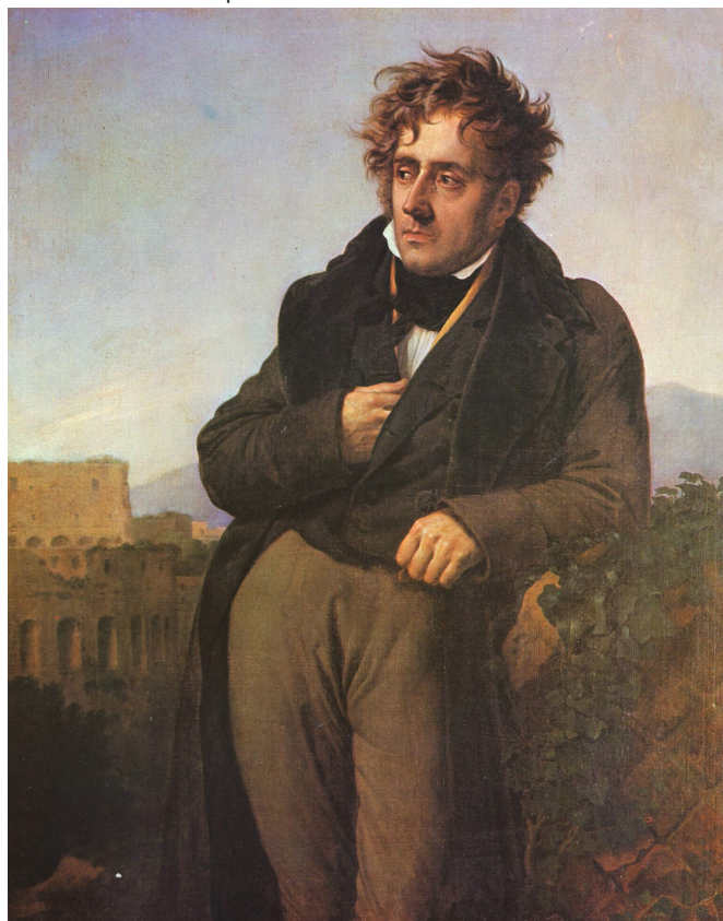
Chateaubriand pintado por Anne-Louis Girodet, en 1810.