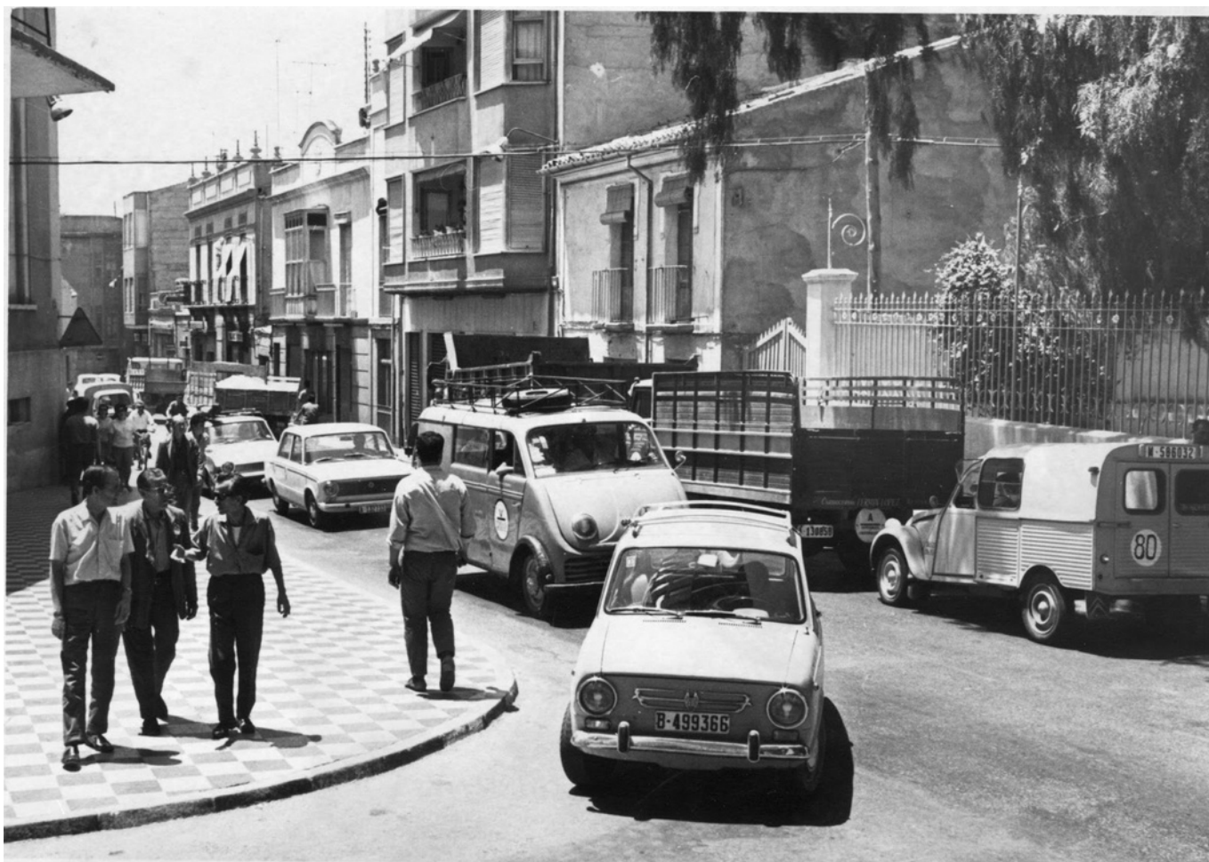
Imagen de la calle Jardines.

Un 11 de febrero de 1975 y con casi un mes de retraso se inaugura la denominada " Variante de Elda " que venía a satisfacer la antigua demanda municipal para evitar que la carretera nacional N-330 atravesara la ciudad, convirtiendo a la calle Jardines y la avenida de Chapí en travesías con una cada vez mayor circulación de vehículos diarios. Automóviles y camiones que suponían un peligro para las personas, al tiempo que el tránsito por Elda ralentizaba considerablemente la fluida circulación por carretera.