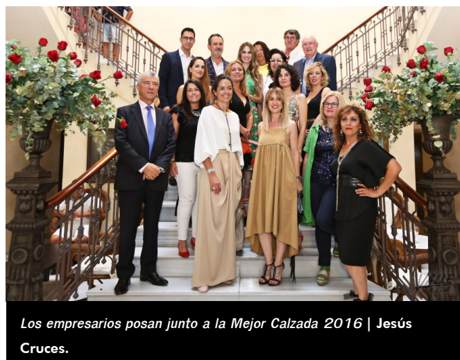
Los empresarios posan junto a la Mejor Calzada 2016