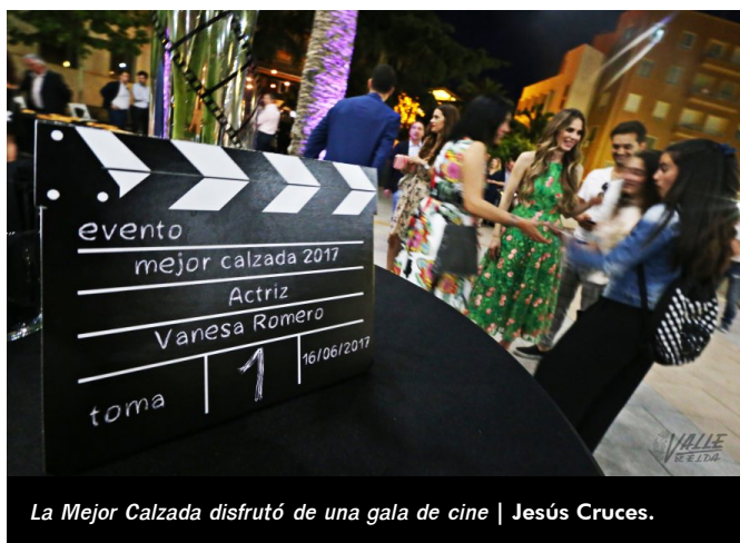
La Mejor Calzada disfrutó de una gala de cine

Durante la gala también se homenajeó a Stuart Weitzman , recientemente jubilado, por la confianza que ha depositado en Elda y Petrer durante tantos años al fabricar sus zapatos aquí.