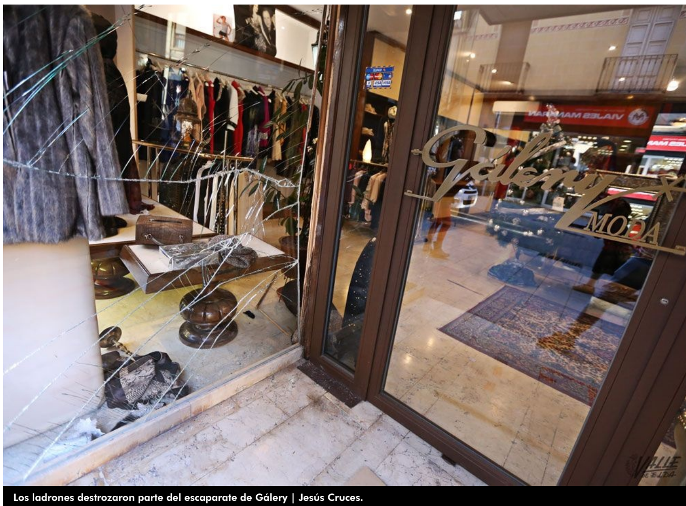
Los ladrones destrozaron parte del escaparate de Gálery

La tienda de ropa de moda Gálery, ubicada en la céntrica calle Jardines de Elda, sufrió durante la pasada madrugada un robo. La Policía Nacional sospecha que este hecho delictivo ha sido perpetrado por la misma banda que lleva atemorizando con una media de dos robos semanales a los comerciantes de Elda y Petrer durante los dos últimos meses.