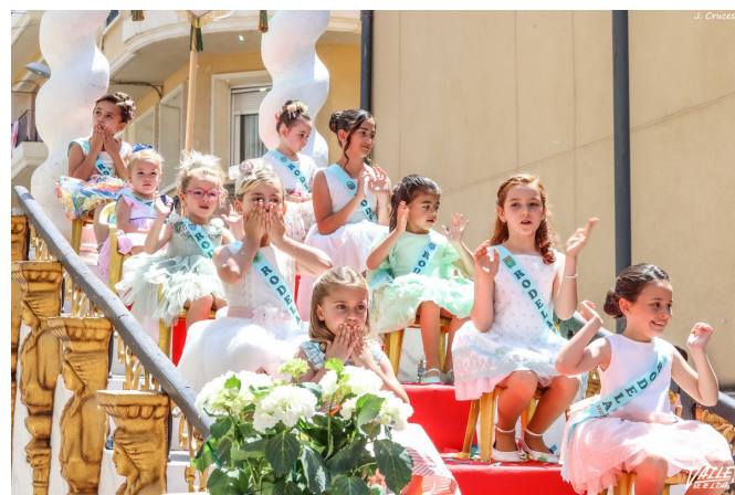
Las rodelas de este año han cogido hoy el testigo.

Entonces ha llegado el momento más esperado, cuando las rodelas salientes han hecho entrega del escudo a las nuevas representantes de la fiesta. Cuando ambas estaban en el escenario ha sonado el conocido trueno de los arcabuces, y ellas se han saludado con su típico baile entre los aplausos del público.