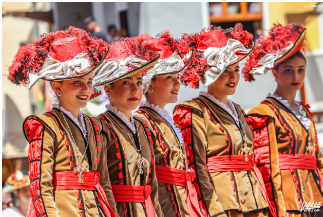
Filà de jóvenes de la comparsa Tercio de Flandes.

Entonces ha tomado el relevo el bando de la cruz con un boato de los Labradores en el que también se ha rendido homenaje a la figura de la rodela a través de sus históricos trajes. Continuaban Vizcaínos, Marinos, Tercio de Flandes y Estudiantes.