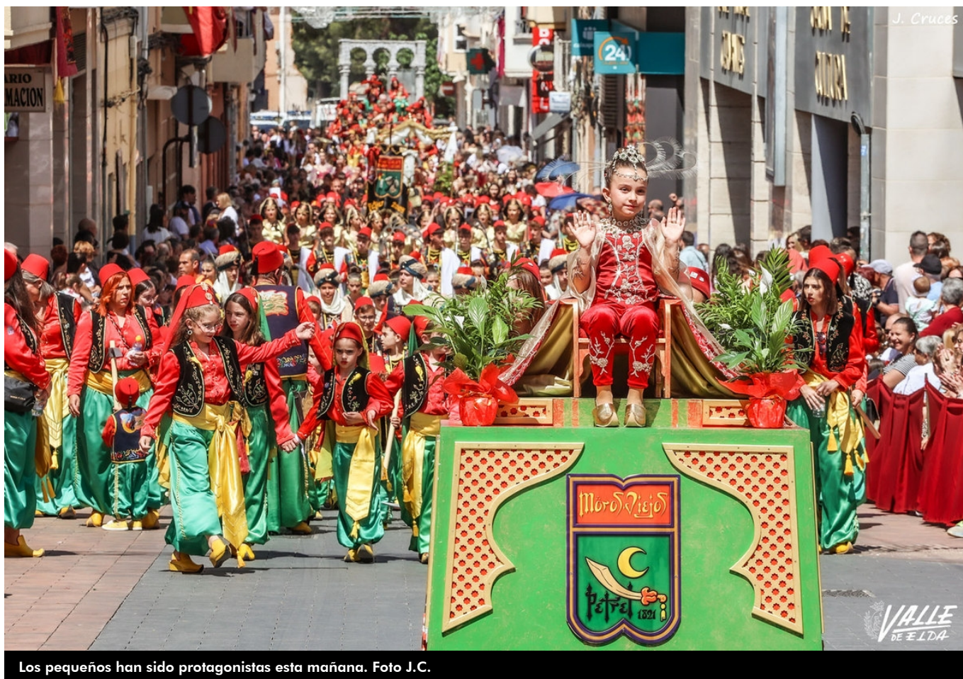
Los pequeños han sido protagonistas esta mañana.

El futuro de la fiesta en Petrer está asegurado. Muestra de ello ha sido el Desfile Infantil que se ha celebrado esta mañana en el que cientos de niños han desfilado con grandes sonrisas y mucha ilusión. Las grandes protagonistas de este acto son las rodelas, y hoy se ha producido el relevo entre los cargos salientes y entrantes.