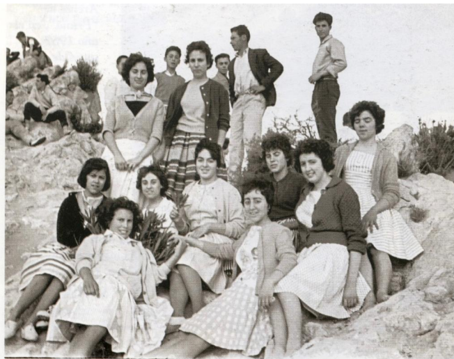
En las rocas de la parte superior del Arenal. Día de mona, abril 1961.

de estas personas y de su predisposición para que el Arenal de l'Almorxó estuviera perfecto me ha parecido interesante contarla. Ojalá este tipo de acciones estuvieran generalizadas porque nuestro entorno y nuestro medio ambiente seguro que lo agradecería.