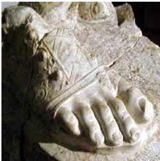
Persikai, detalle de escultura.

En la época clásica los griegos calzaron una sandalia llamada "persikai" que era muy cómoda de calzar y la usaban las personas de edad, el nombre lo tomaba de su origen en Persia.