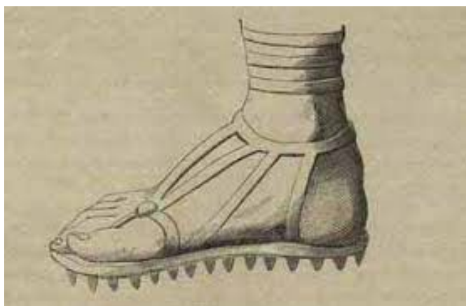
Krepis de soldado.

La Krepis, disponible únicamente para los hombres libres, con la lengüeta tallada o hecho con tiras y la suela claveteada para los soldados.