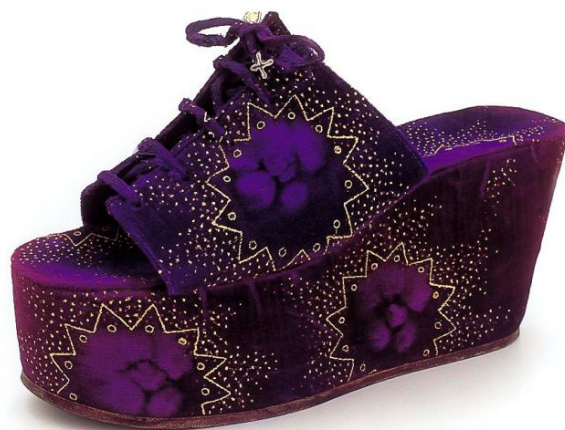
Calzado tipo Coturno utilizado en la escena. Museo del Calzado (Reprod.).

El Akatioi, que quizás tenía el origen en la civilización Hitita por la forma de la punta hacia arriba.