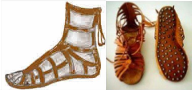
Ilustración del calzado y calzado Koila Upodémata, reproducción.

En la época clásica los griegos calzaron una sandalia llamada "persikai" que era muy cómoda de calzar y la usaban las personas de edad, el nombre lo tomaba de su origen en Persia.