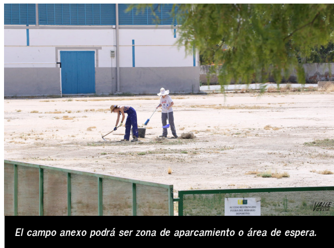
El campo anexo podrá ser zona de aparcamiento o área de espera.

llegan nuevas vacunas de otras marcas”, ha concluido Alfaro.