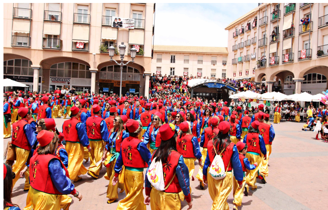
La Plaza Mayor se ha tornado amarilla durante el tradicional "Caracol"

Infantil, que comenzará desde la Plaza Castelar hasta la calle Padre Manjón.