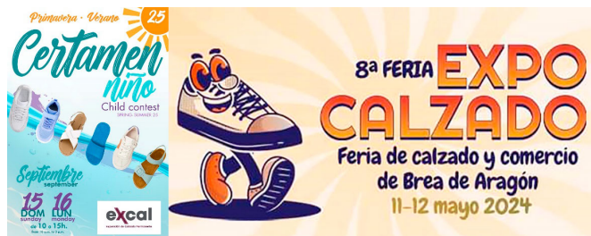
Carteles de los certámenes de calzado de niño en Madrid y la Expo en Brea.

Pero hay más, cada pueblo zapatero trata con sus propios recursos mantener sus señas que lo han identificado como fabricantes de un determinado tipo de calzado, son los casos de Brea de Aragón; de Arnedo en la Rioja; de Baleares, especialmente en Mallorca o Menorca; Barcelona con su prestigiosa “Estil & Moda”; Valverde del Camino o la muestra anual de calzado de yute que promociona el Ayuntamiento y las industrias de Caravaca de la Cruz, entre otras.