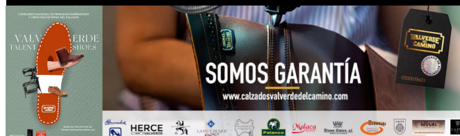
Concurso Nacional y promoción de su calzado en Valverde del Camino.

También en Barcelona y otras importantes capitales se celebran anualmente exposiciones o certámenes de calzado, donde se exhiben junto al calzado, otros productos de marroquinería.