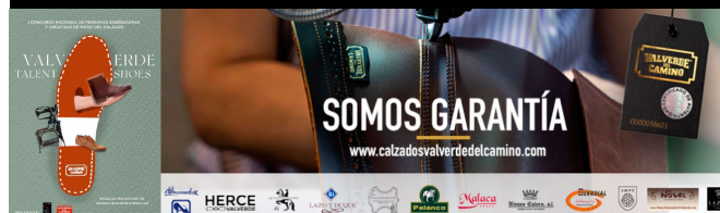
Concurso Nacional y promoción de su calzado en Valverde del Camino.

También en Barcelona y otras importantes capitales se celebran anualmente exposiciones o certámenes de calzado, donde se exhiben junto al calzado, otros productos de marroquinería.