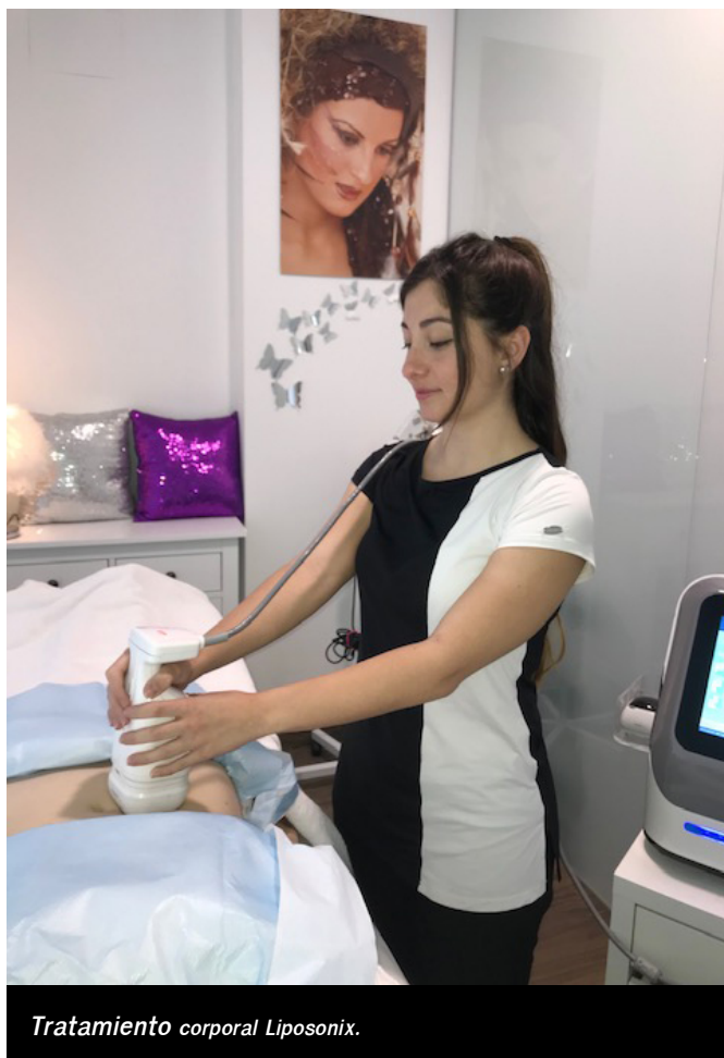
Tratamiento corporal Liposonix.

De cara al verano, sobre todo, se hace pesado tener que someterse cada pocas semanas a una depilación, por ello y pensando en aquellas personas que quieran dejar de perder su tiempo en esto cuentan con un láser diodo que destaca por ser eficaz e indoloro en todo tipo de piel y pelo. Es la mejor forma de decir adiós a la cera o a la cuchilla en el último momento.