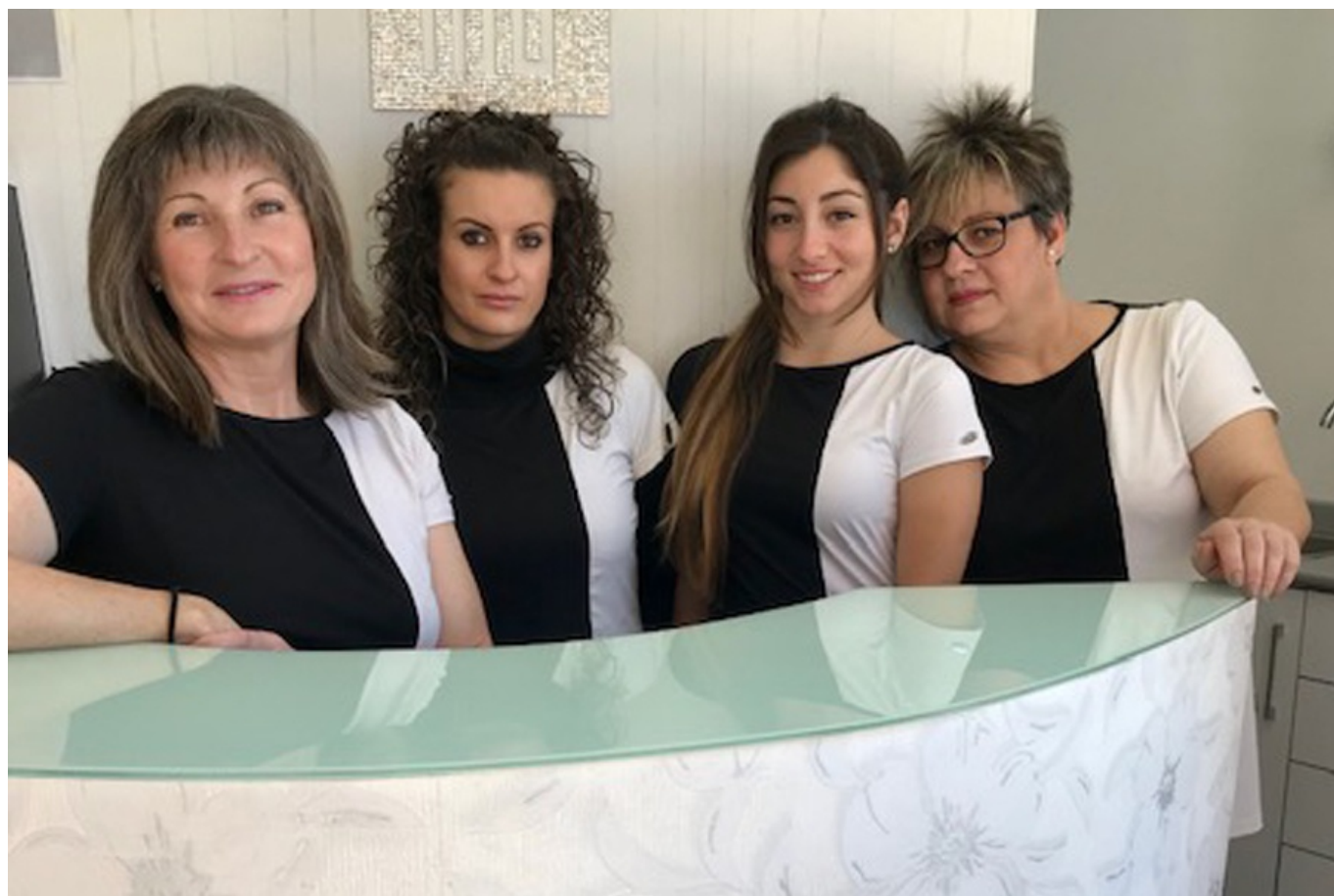
Las profesionales del salón de estética están altamente cualificadas.