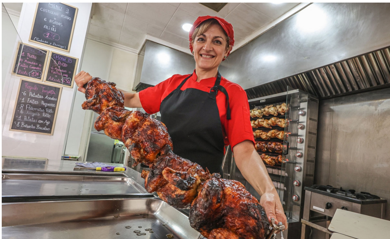
Los platos más solicitados son costillas asadas, rustidera, paella de pollo, arroz a banda, pollo asado o gazpachos.

Asados Avenida abre cada fin de semana con el objetivo de ayudar a sus clientes a disfrutar al máximo de su tiempo libre y olvidarse de la cocina. Por ello, cada fin de semana prepara diferentes platos caseros para que siempre tengan donde elegir. Si por algo destaca Asados Avenida es porque cocina con mimo, de forma totalmente casera, lo que permite ofrecer sabores deliciosos y únicos, siempre al mejor precio.