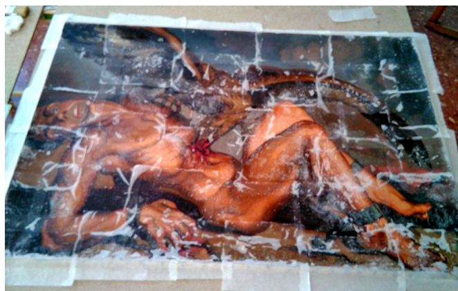
Uno de los pasos del proceso de restauración de Prometeo cuando el águila le está devorando el hígado.

El Atrio de Gea, son expertos en la materia. Se encuentran en la calle Comparsa Tercio de Flandes, 7, en la zona de El Campet, Petrer. El teléfono es el 678 081 931.