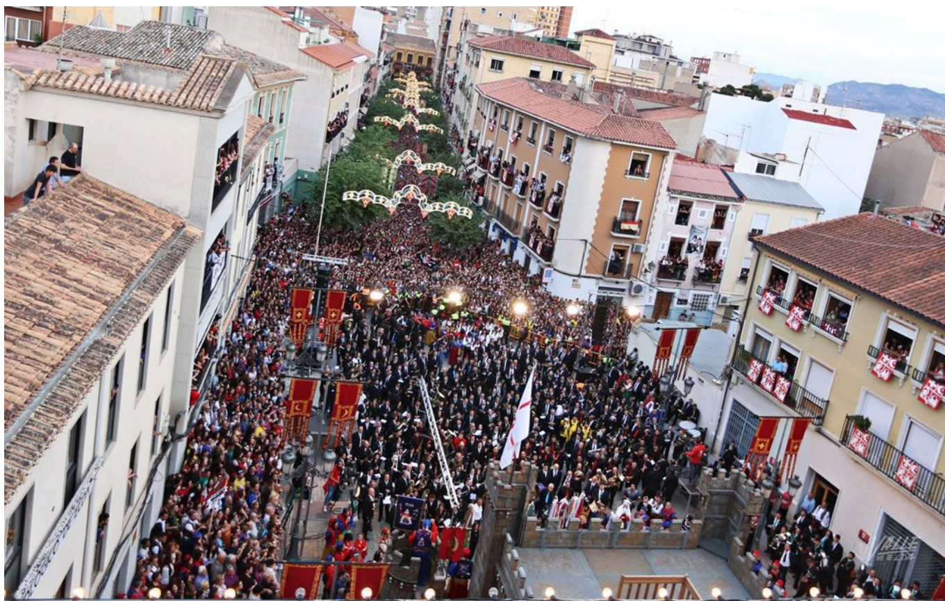
Miles de personas han desbordado la calle Colón | Jesús Cruces.

Elda ha vivido esta noche uno de los actos más emotivos de sus Moros y Cristianos, la Entrada de Bandas en la Plaza de la Constitución, el acto que da inicio a las fiestas. Un año más miles de eldenses han llenado la calle Colón para cantar a una sola voz y con pasión el himno de las fiestas, el pasodoble Idella . Los festeros, con los nervios a flor de piel, han demostrado la pasión que sienten por las fiestas pues coreaban a todo pulmón el himno mientras saltaban y bailaban al son de música.