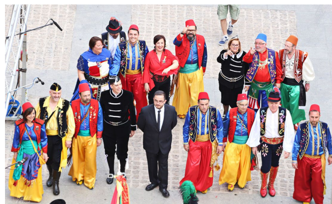
Los cargos festeros y municipales han iniciado el pasacalles | Jesús Cruces.

Esta noche cuando el reloj marque la medianoche comenzará la Retreta, el primer desfile oficial de los Moros y Cristianos, los festeros recorrerán el centro de la ciudad con los trajes oficiales de sus comparsas.