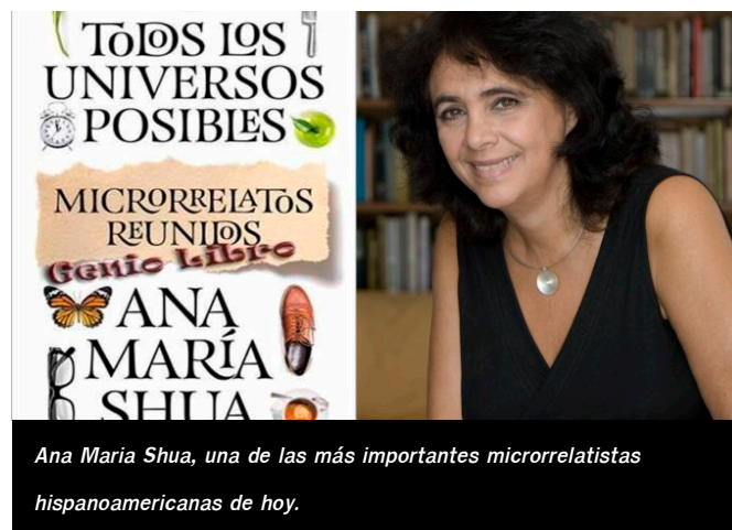
Ana María Shua, una de las más importantes microrrelatistas hispanoamericanas de hoy.

Todos ellos asimilarán el gran legado de sus predecesores (Borges y Monterroso serán referentes por sus concepciones singulares del género) y proseguirán ensanchando tanto la variedad temática, donde lo fantástico, lo paradójico y lo absurdo llega a cotas extremas, como el enfoque y el tono narrativos, donde el humor más o menos negro y el sinsentido no cesarán. Hasta hacer del microrrelato un género singular en el que si algo prima hoy son la diversidad de propuestas, el eclecticismo y la originalidad.