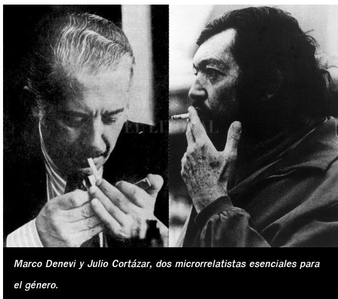
Marco Denevi y Julio Cortázar, dos microrrelatistas esenciales para el género.

Junto a Darío, se detiene David Lagmanovich en su ineludible trabajo El microrrelato, Teoría e historia , en otros seis auténticos precursores del género en Hispanoamérica: Alfonso Reyes, Julio Torri, Leopoldo Lugones, Ramón López Velarde, Vicente Huidobro o Macedonio Fernández . Visto con perspectiva, y atendiendo a los criterios con que hoy se define el género, el más valioso de todos ellos es sin duda Julio Torri, autor en el que brevedad, intertextualidad e hibridación de géneros son ya patentes. También son reseñables los "cuentos diminutos" de Huidobro, los humorismos de Macedonio Fernández, en la órbita de su buen amigo Ramón Gómez de la Serna o las mínimas incursiones de López Velarde en el incipiente género.