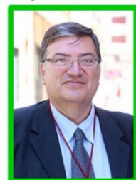
Eduardo Timor Urbanismo, Actividades