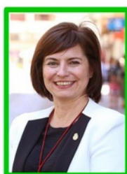
Rosa Vidal Cultura, Museos