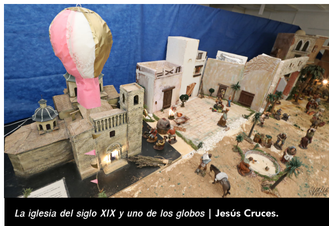
La iglesia del siglo XIX y uno de los globos