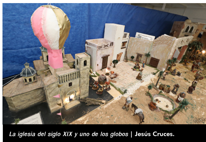
La iglesia del siglo XIX y uno de los globos | Jesús Cruces.

Valero indica que lo importante de estas tradiciones es que "cohesionan a un pueblo, pues no importa el sexo, la edad ni la condición social, los eldenses corren juntos" . Por este motivo ha querido plasmarlo, para recordar la importancia de querer y proteger las costumbres. Para Francis Valero, "lo más bonito es que la gente sigue acudiendo a ver su belén año tras año, sobre todo los fines de semana".