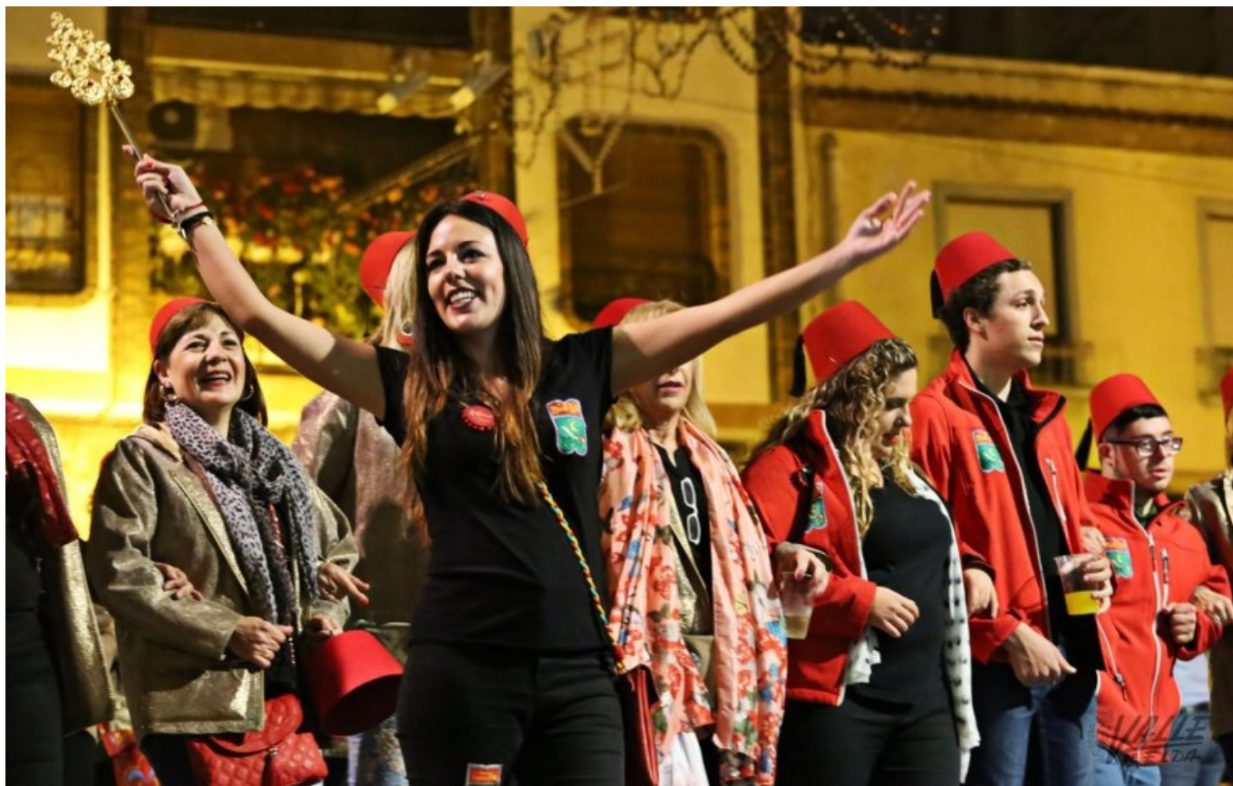
La ilusión por volver a desfilar destacaba en las caras de los festeros | Jesús Cruces.

Ahora sí, Petrer inició anoche la cuenta atrás para sus fiestas de Moros y Cristianos, que se celebran del 17 al 21 de mayo con la primera jornada de sus Entraetas. En el casco antiguo reinaba el ambiente festero , pues el buen tiempo animó a que la población se echase a las calles para disfrutar de nuevo de los pasodobles, las marchas moras y las cristianas.