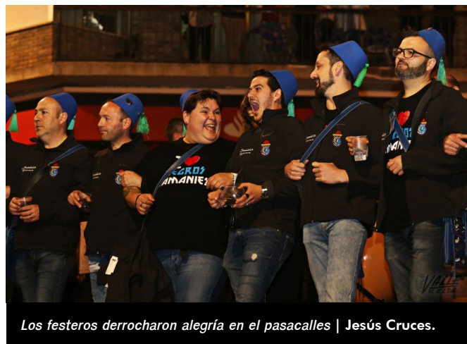
Los festeros derrocharon alegría en el pasacalles