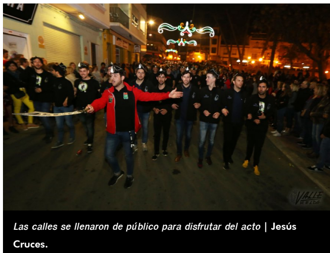
Las calles se llenaron de público para disfrutar del acto | Jesús Cruces.

La celebración no acabó tras el desfile, los cuartelillos se llenaron de gente hasta altas horas de la madrugada . Este año la comparsa Estudiantes acogió en su cuartelillo una fiesta abierta al público .