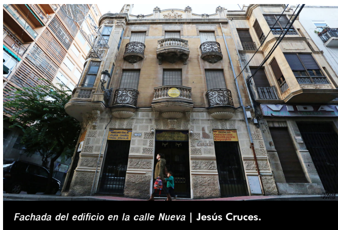
Fachada del edificio en la calle Nueva | Jesús Cruces.

El deseo de la familia es que este edificio sea para el disfrute del pueblo y que podría convertirse en sala de exposiciones, biblioteca, oficinas, entre otras opciones, por eso han presentado la propuesta de venta al Ayuntamiento, por 350.000 euros y de su posterior restauración, cuyo coste estiman en casi 400.000 euros . Algo similar sucedió con la casa de la Viuda de Rosas , que actualmente es la sede de la Junta Central de Comparsas y es un BRL que disfrutaban los eldenses , también situada en la calle Nueva, justo enfrente.