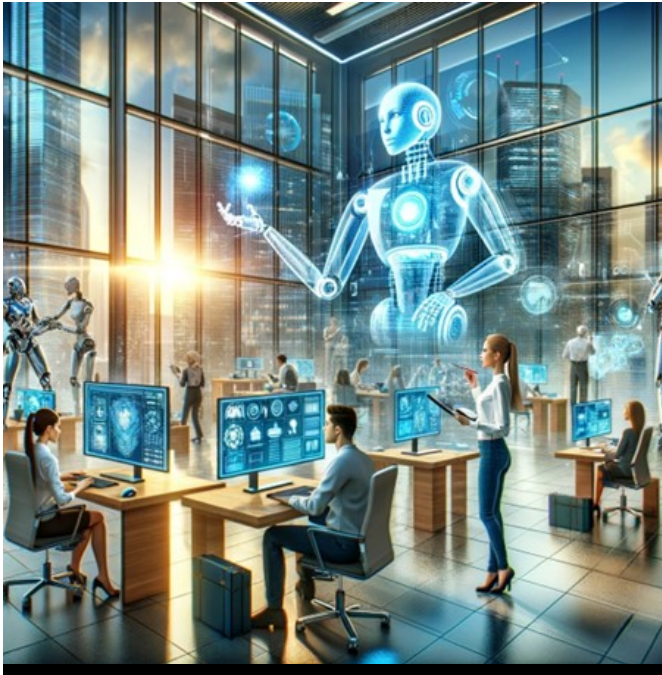
Imagen creada con Chat GPT DALL-E

Desgraciadamente, acabamos de salir de un momento histórico, el de la tercera revolución industrial que trajo de la mano la informática, del que no hemos salido airosos. No hemos sido capaces de superar el status de usuarios encapsulados en ignorancia. Han surgido iniciativas de éxito que han explotado justamente la distancia a la que nos hemos situado de la tecnología, conformándonos con los resultados que ofrecían. Han sido pocos, otros, los que se han beneficiado de los avances. Un progreso ficticio nos ha nublado la visión en la que el desarrollo no ha traído de la mano el progreso que podría haber facilitado. Eso nos ha llevado a que nuestro nivel de cualificación en estos momentos es escaso, para lo que requieren las circunstancias.