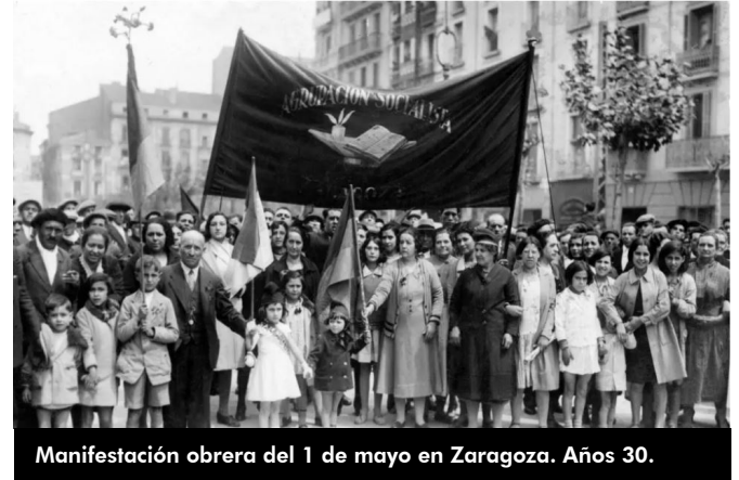
Manifestación obrera del 1 de mayo en Zaragoza. Años 30.