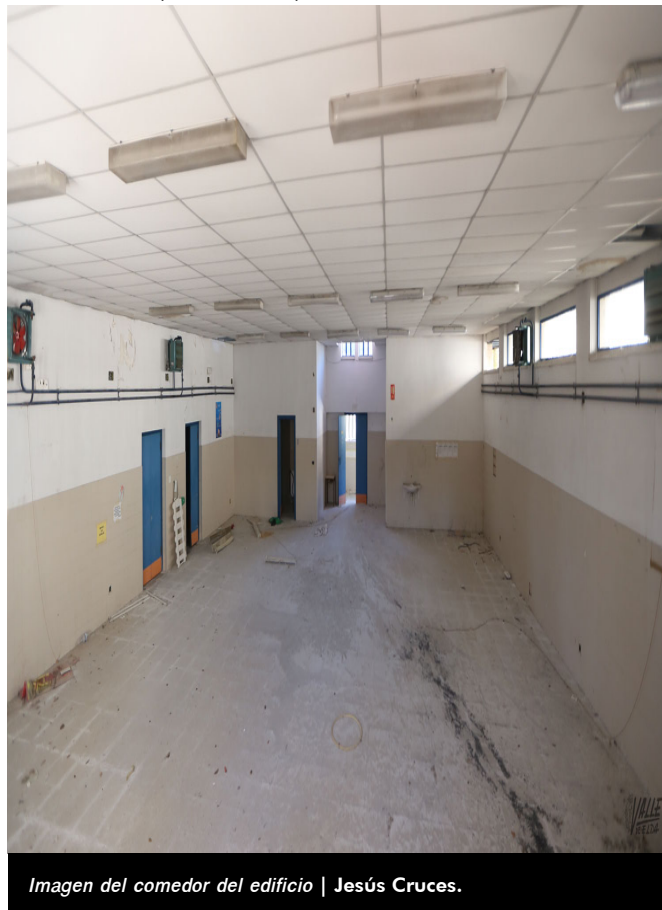
Imagen del comedor del edificio