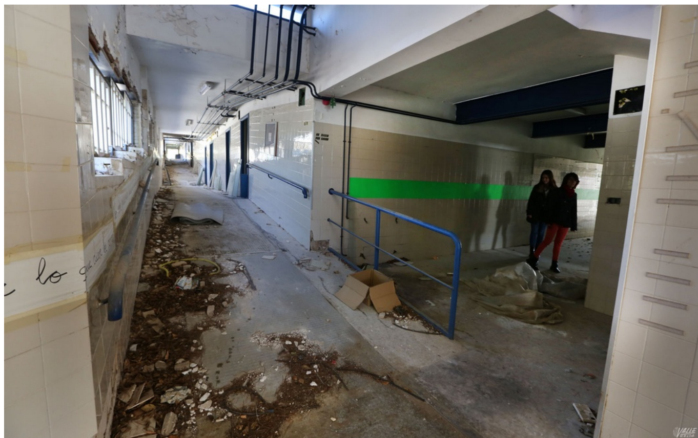
Imagen del interior del antiguo colegio Miguel de Cervantes | Jesús Cruces.

La Policía Local de Elda ha acudido esta mañana a cerrar el acceso al antiguo edificio del colegio Miguel de Cervantes , ubicado entre el Hospital General Universitario y ASPRODIS después de que Valle de Elda comprobara que, aunque la puerta principal está cerrada , el acceso de atrás había sido forzado y se habían llevado varias puertas, por lo que el colegio se encuentra totalmente abierto y hay signos de que el robo iba a continuar con las ventanas.