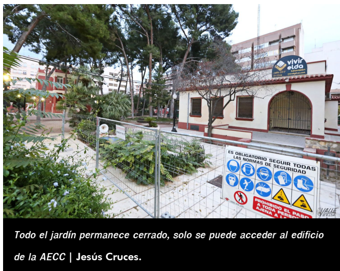
Todo el jardín permanece cerrado, solo se puede acceder al edificio de la AECC | Jesús Cruces.

Ahora la empresa a la que se le ha concedido la licitación, Paramento , está realizando los trabajos previos a la obra, que comenzará a finales de esta misma semana. Mientras se pone a punto este edificio, el Jardín de la Música ha sido cerrado al público por seguridad y solo podrán utilizarlo los usuarios de la Asociación Española Contra el Cáncer , cuya sede se encuentra situada en la parte baja del parque.