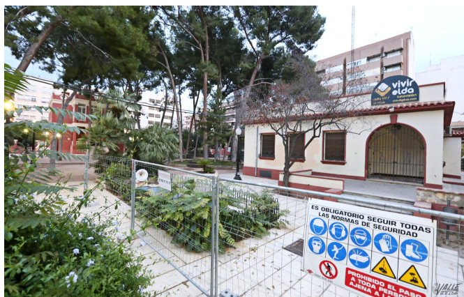
Todo el jardín permanece cerrado, solo se puede acceder al edificio de la AECC

Ahora la empresa a la que se le ha concedido la licitación, Paramento , está realizando los trabajos previos a la obra, que comenzará a finales de esta misma semana. Mientras se pone a punto este edificio, el Jardín de la Música ha sido cerrado al público por seguridad y solo podrán utilizarlo los usuarios de la Asociación Española Contra el Cáncer , cuya sede se encuentra situada en la parte baja del parque.