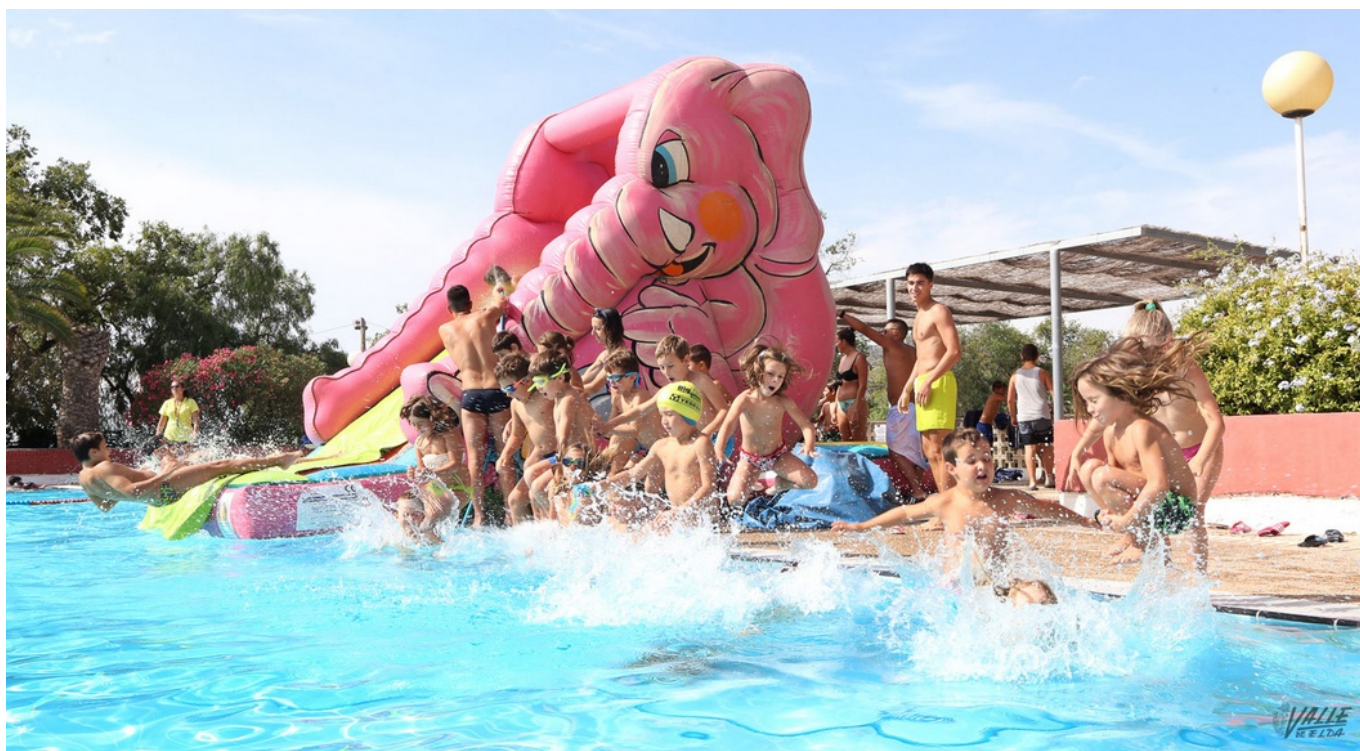
Cientos de eldenses visitan las piscinas municipales de San Crispín durante los meses de verano.

Hacer planes en la comarca durante esta época del año sin sufrir los rigores del calor es misión imposible. Muchas personas se marchan de vacaciones, pero otras tantas se quedan en sus hogares y optan por realizar salidas diarias a puntos cercanos . Numerosos vecinos de Elda y Petrer palían los más de 30 grados de media que se registran cada día con un buen baño .